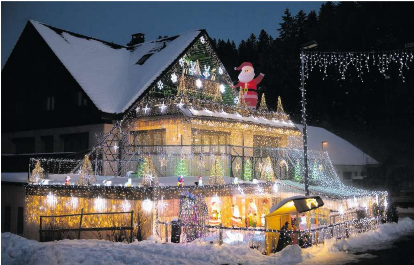
In Escholzmatt scheut man keine Kosten und Mühen für die weihnachtliche Atmosphäre.

Advent, Advent, ein Lichtlein brennt: Luzernerinnen und Luzerner lassen die dunklen Winternächte eindrucksvoll erhellen.