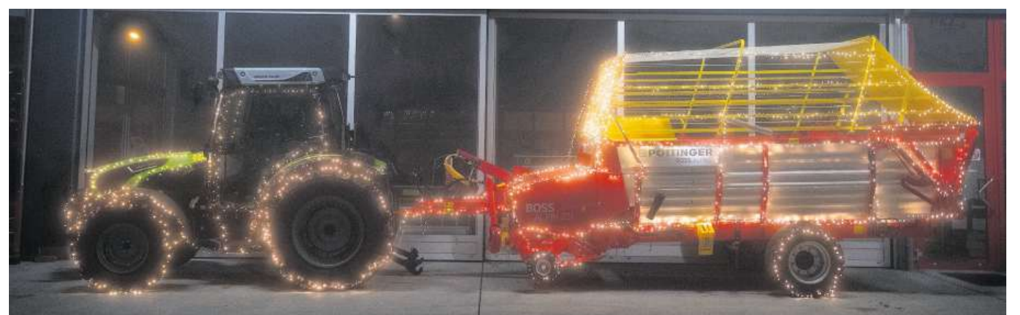
Auf dem Land wird nicht nur das Haus, sondern auch der Deutz in Szene gesetzt.

Kundschaft damit in die Läden zu ziehen. Um während der dunklen Jahreszeit Freude und Licht zu verbreiten, schmücken heute ebenso viele Private ihr Haus mit Lichtern und sonstiger weihnachtlicher Deko. (fmi)